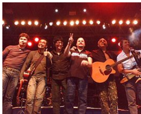
Integrantes originais do grupo, da esquerda para a direita: Serginho Herval , Nando , Cleberston Horsth , Paulinho , Ricardo Feghali e Kiko