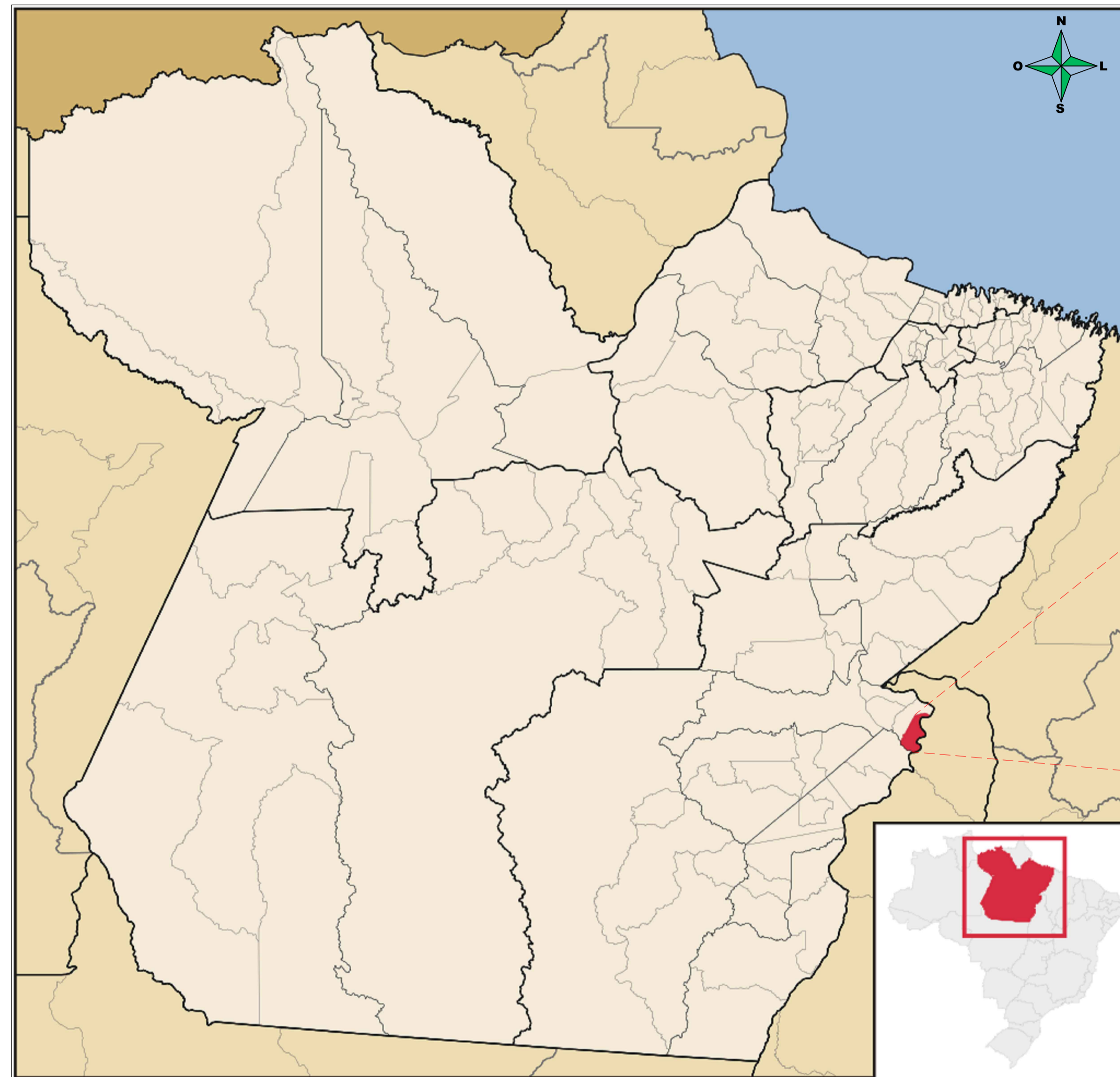
01 ESTADO DO PARÁ ESCALA ..... SEM/ESC